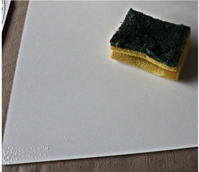
Nat maken met een spons.

Dep de spons in het kommetje niet al te nat. Je ziet op de rechterplaat nog enkele bolletjes sop.