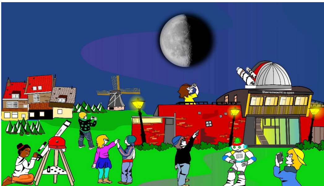
Toon met de modellen hoe het laatste kwartier ontstaat van de maan