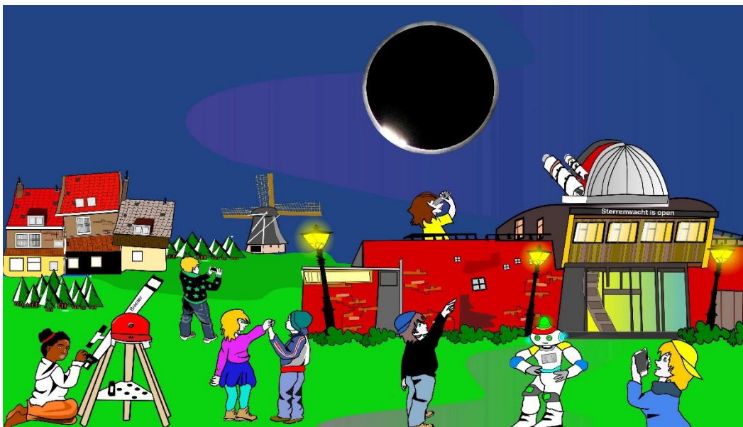
Toon met de modellen hoe een zonsverduistering ontstaat