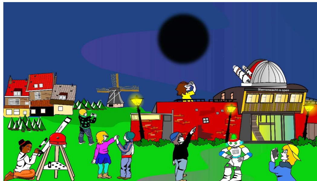
Toon met de modellen hoe een nieuwe maan ontstaat