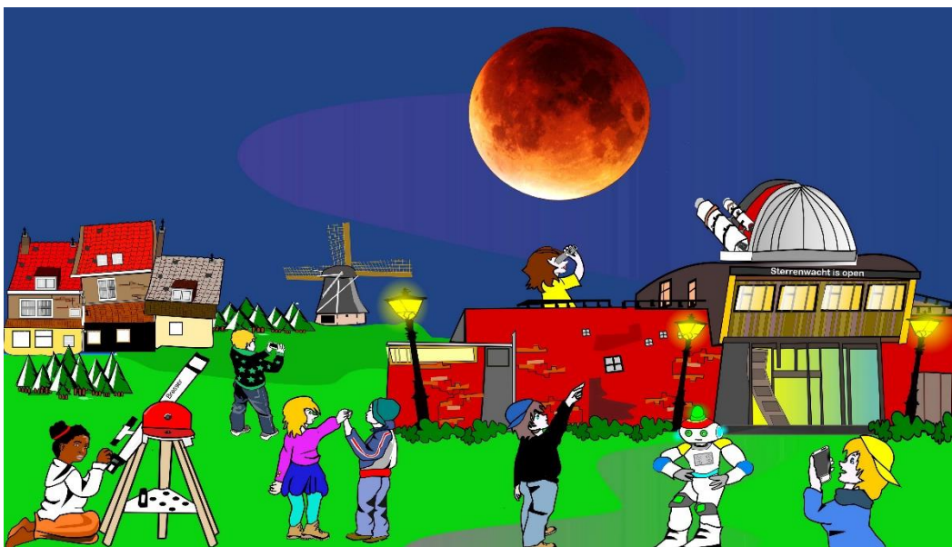
Toon met de modellen hoe een maansverduistering ontstaat