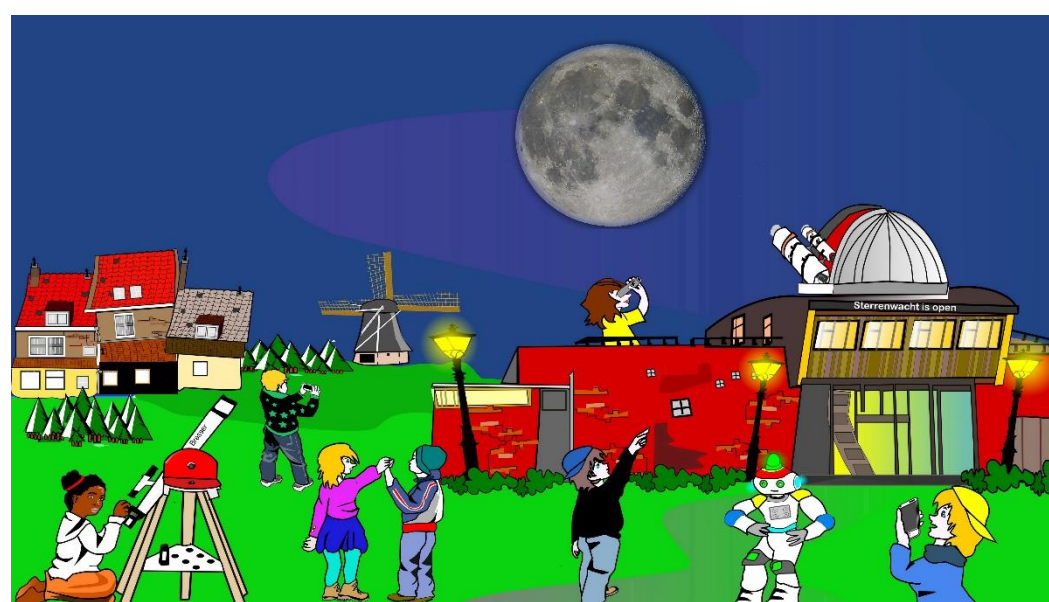
Toon met de modellen hoe een volle maan ontstaat