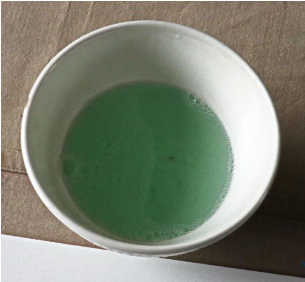
Kommetje met sop

Hierdoor kun je dat sticker wat makkelijker verschuiven naar de juiste plaatst.