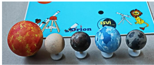
Planeten op een voetje.