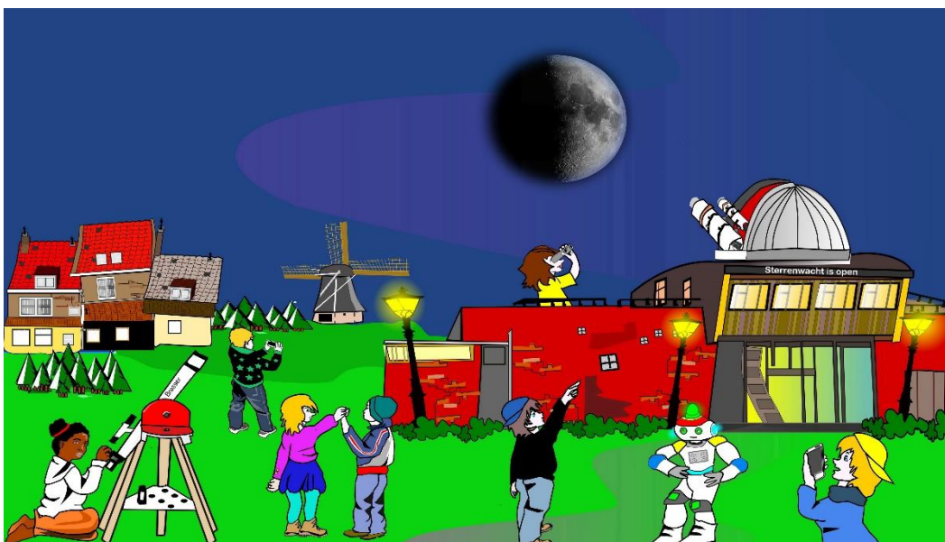
Toon met de modellen hoe het eerste kwartier ontstaat van de maan